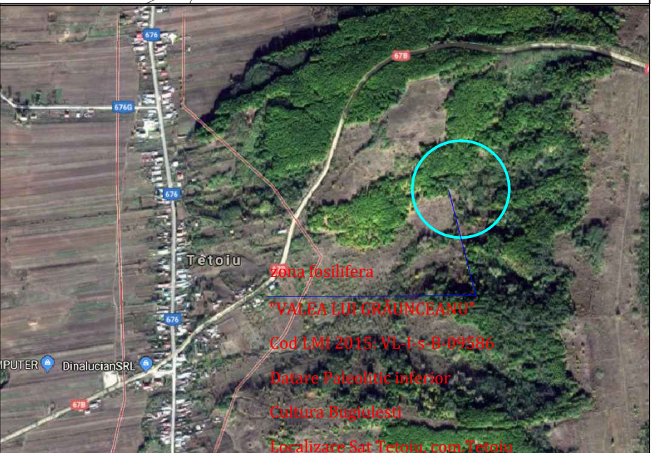
Imagine satelitară zona fosilifera "Valea lui Graunceanu", sat Tetoiu, comuna Tetoiu